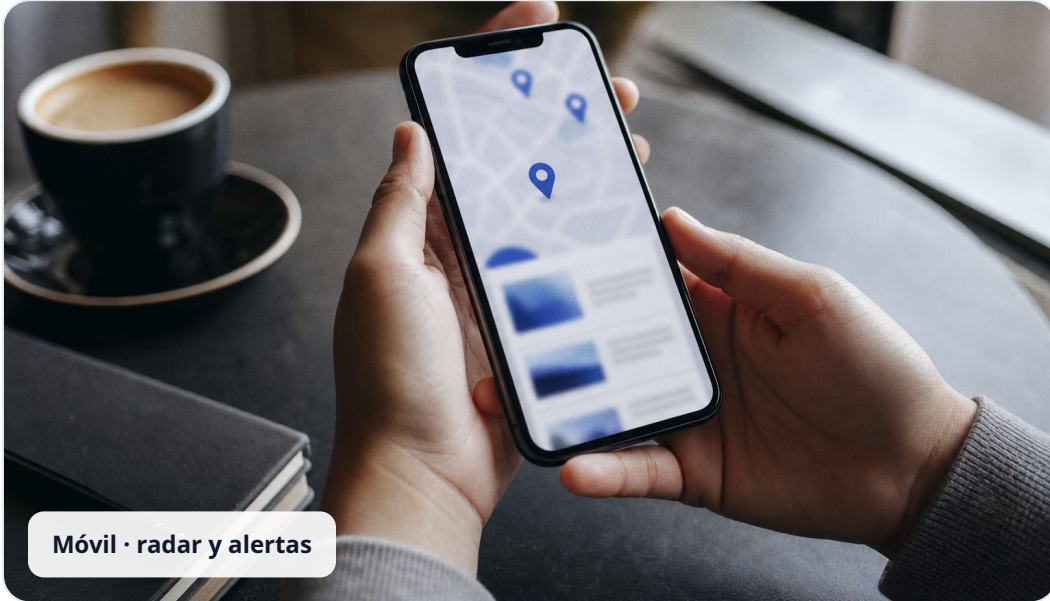
Móvil · radar y alertas