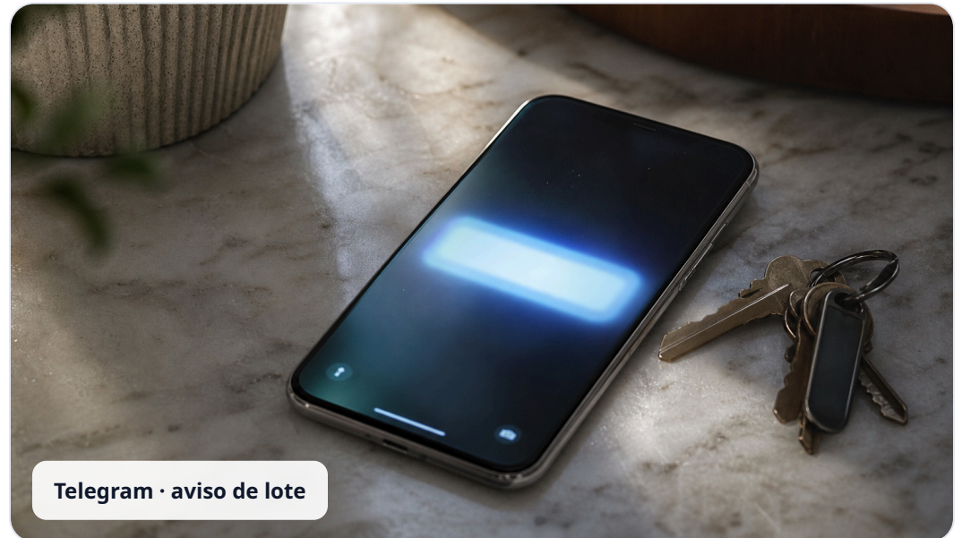
Telegram · aviso de lote