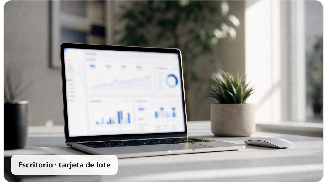
Escritorio · tarjeta de lote