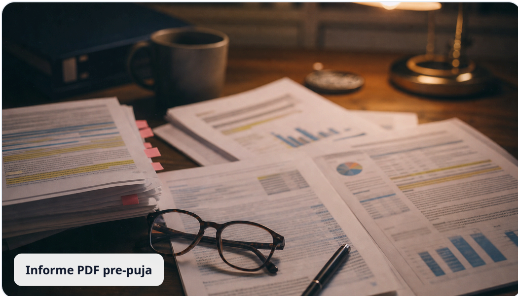
Informe PDF pre-puja